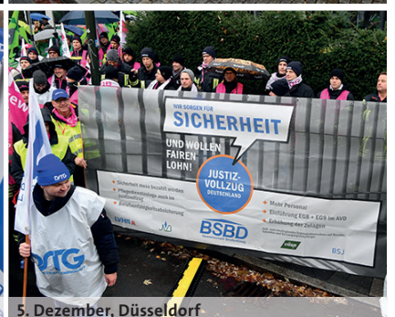
5. Dezember, Düsseldorf