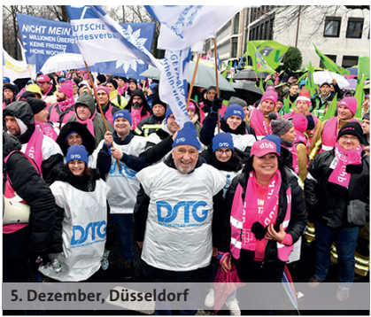
5. Dezember, Düsseldorf