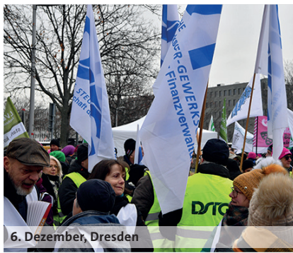
6. Dezember, Dresden