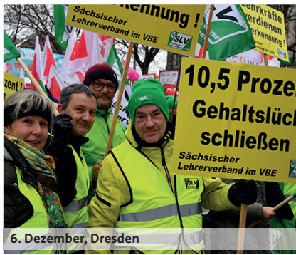
6. Dezember, Dresden