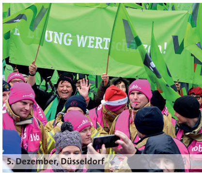
5. Dezember, Düsseldorf