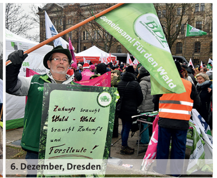
6. Dezember, Dresden

Rahmenbedingungen sind inakzeptabel. Wir kämpfen weiter für eine bessere Zukunft und mehr Investitionen in die Bildung!“