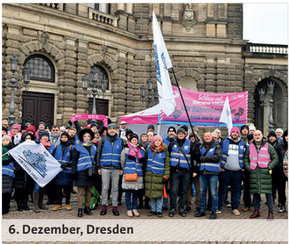
6. Dezember, Dresden