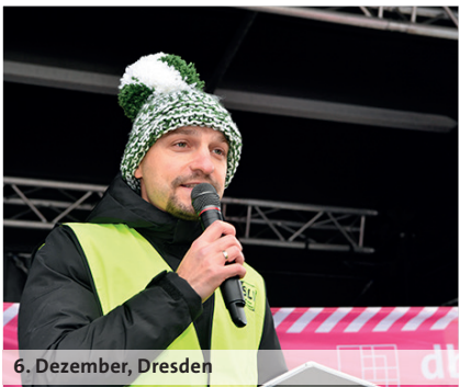
6. Dezember, Dresden