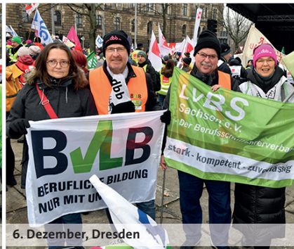
6. Dezember, Dresden