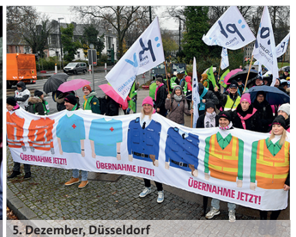
5. Dezember, Düsseldorf