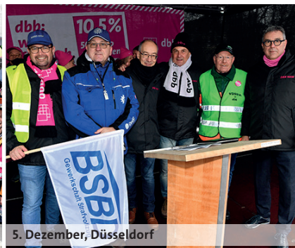
5. Dezember, Düsseldorf