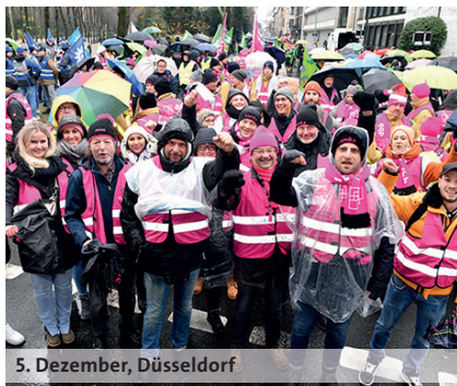
5. Dezember, Düsseldorf