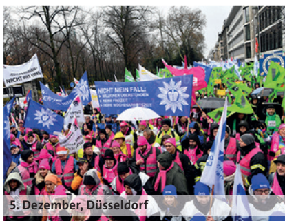
5. Dezember, Düsseldorf