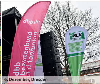
6. Dezember, Dresden