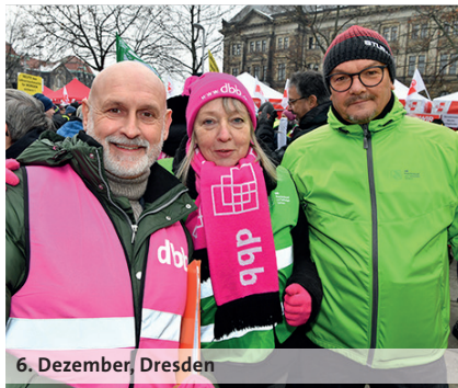
6. Dezember, Dresden