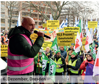
6. Dezember, Dresden