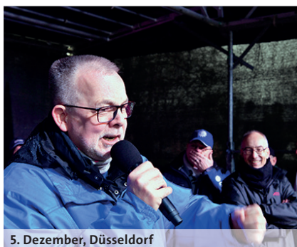
5. Dezember, Düsseldorf