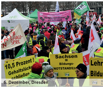
6. Dezember, Dresden