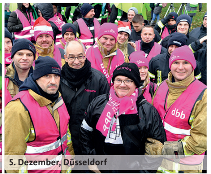
5. Dezember, Düsseldorf