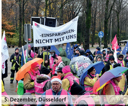
5. Dezember, Düsseldorf