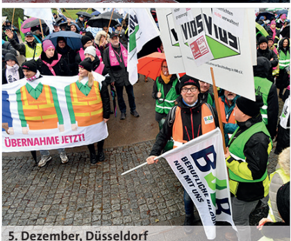
5. Dezember, Düsseldorf