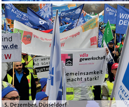
5. Dezember, Düsseldorf