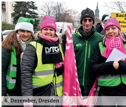
6. Dezember, Dresden