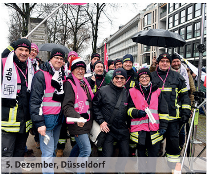
5. Dezember, Düsseldorf