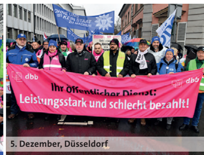
5. Dezember, Düsseldorf