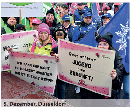
5. Dezember, Düsseldorf

Einen Tag vor Beginn der dritten Verhandlungsrunde forderten zahlreiche sächsische Landesbeschäftigte von ihrer Landesregierung lautstark ein Ende der Verweigerungshaltung.