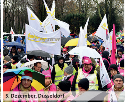
5. Dezember, Düsseldorf

Versorgung. Sonst werden wir nicht nur zu wenig Leute bekommen, sondern die vorhandenen werden weglauen – das kann niemand wollen.“