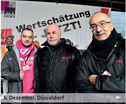
5. Dezember, Düsseldorf