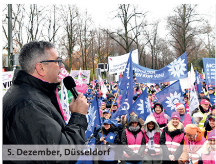
5. Dezember, Düsseldorf