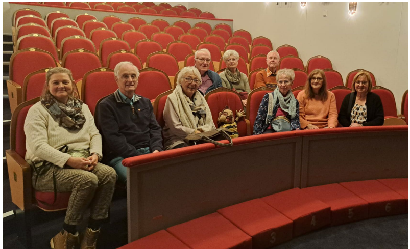
Die lehrer nrw Gruppe im Marionettentheater.