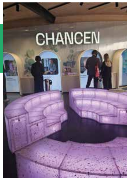
Blick in die „experimenta – Das Science Center“ in Heilbronn

Der KI-Schulpreis hat eindrucksvoll gezeigt, wie viel Innovationskraft bereits heute in unseren Schulen steckt. Diese Dynamik gilt es aufzugreifen, struktu-