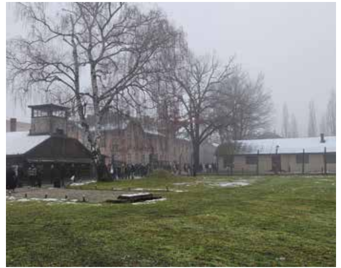
Das Hauptlager in Auschwitz

Sydney steht dabei stellvertretend für viele weitere Orte, an denen jüdische Gemeinschaften bedroht und angegriffen werden.