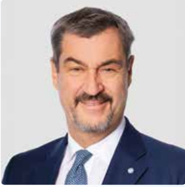
Dr. Markus Söder Bayerischer Ministerpräsident

Bayern ist Bildungsland. Aus Überzeugung setzen wir auf ein differenziertes und durchlässiges Bildungssystem und eine Schullandschaft, die Kinder, Jugendliche und junge Erwachsene bestmöglich fordert und fördert. Verschiedene Schularten ermöglichen unterschiedliche Schwerpunktsetzungen. Persönlichen Interessen und individuellen Begabungen können wir so besonders gut begegnen.