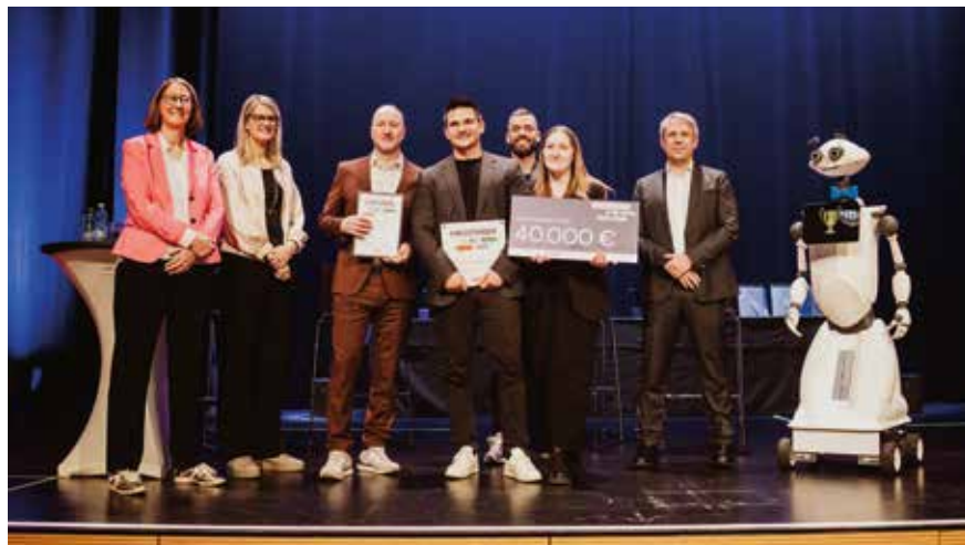
Großzügige Preisgelder und ein informatives Rahmenprogramm mit spannenden Podiumsdiskussionen zeichneten die Veranstaltung zur Verleihung des KI-Schulpreises 2026 aus

Aus Sicht des VDR muss die Debatte nun weiter vertieft und stärker pädagogisch konturiert werden. Entscheidend ist, die Chancen von KI klar herauszu-