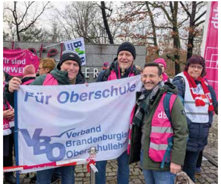
Die Demonstrationen liefen in Bayern, Brandenburg, Sachsen und Nordrhein-Westfalen – die Bundessenorenvertretung wirkte mit