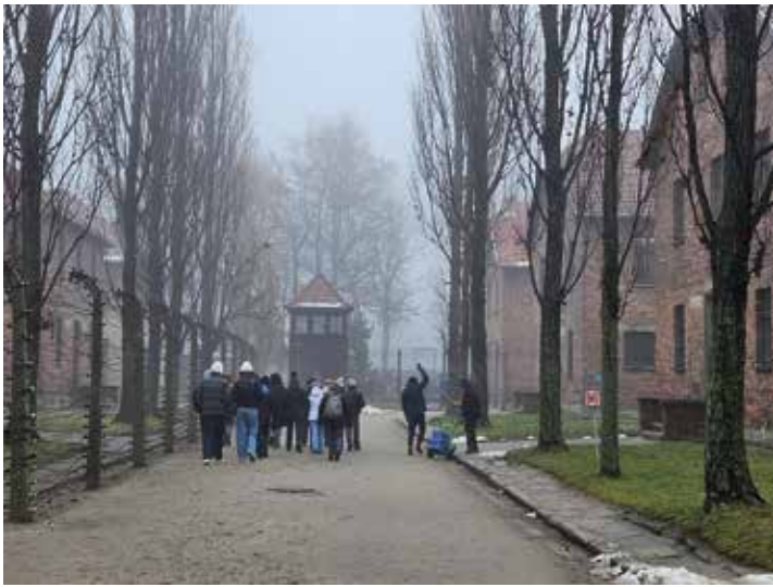
Das Konzentrations- und Vernichtungslager Auschwitz-Birkenau