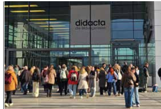
41 Auf der didacta 2026 in Köln